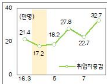
'16.4월(감소 후 반등)