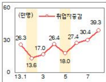
'13.2월 및 5월(감소 후 반등)