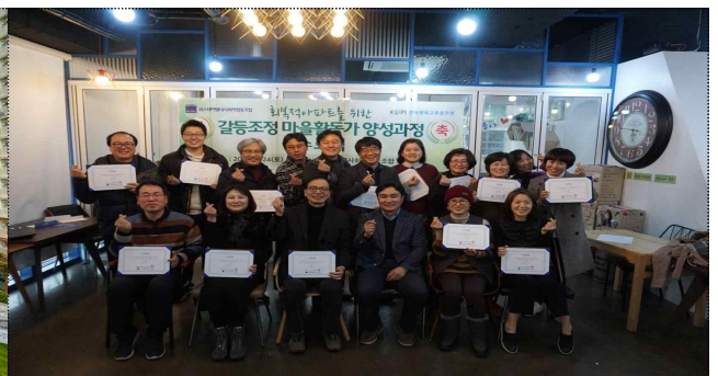
갈등조정위원회 운영을 위한 교육 이수