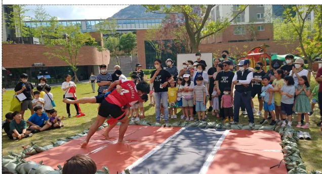
공동체 프로그램 ‘공동체의 날’ 개최