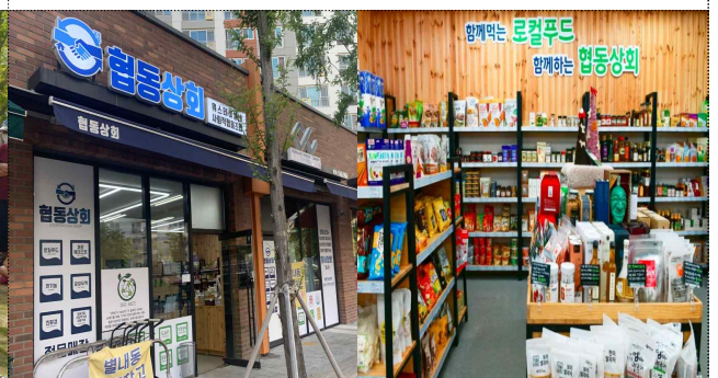
커뮤니티 비즈니스 활성화 사업 ‘협동상회’