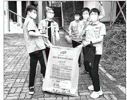
대구 경원고 학교모의협동조합 '줍기살기' 조합원들의 플로깅 활동 모습. 경원

조합원들은 직접 디자인한 '줍기살기' 로고를 넣은 티셔츠도 제작, 판매했다. 1차 제작분 50벌이 모두 팔렸다. 그 수익금으로 필통, 예코백, 클러치백 등 리사이클 제품을 만들어 다시 판매하는 등 지속 가능한 사업으로 확대해 나갈