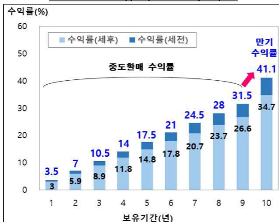
10년물 보유기간별 수익률