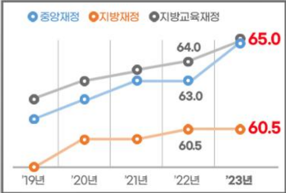
재정별 신속집행 목표 추이(집행률, %)