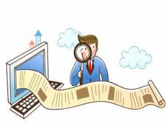
<법·제도 개선 활용>