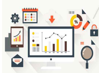
<과학적 정보 생산·축적>