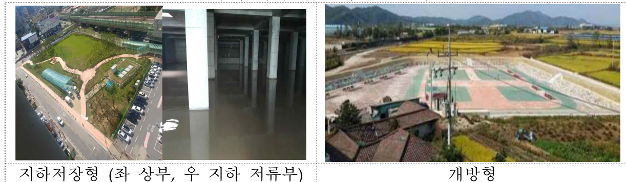
지하저장형 (좌 상부, 우 지하 저류부)