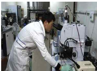
<조사·연구 기반 확보>