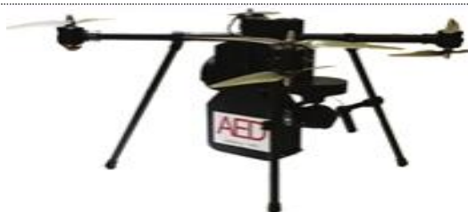
AED 장착 앰블런스 드론