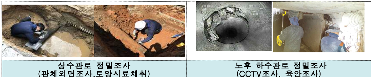
상수관로 정밀조사 (관체외면조사, 토양시료채취)