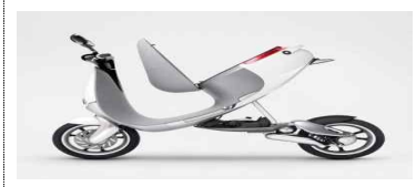
《전기이륜차 배터리팩 교환 스테이션 : 대만》