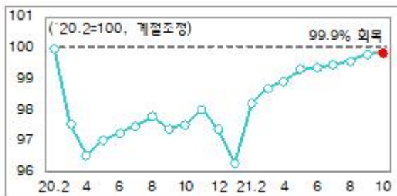
<표2> 코로나 위기 중 한국의 취업자 수준