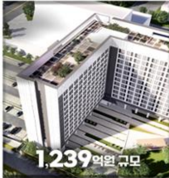
경북 구미1국가산업단 구조고도화