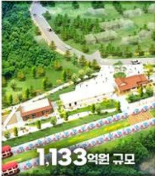
충북 단양역 복합관광단지